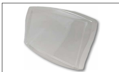
Copertura di protezione in plastica rigida, fornita in dotazione con la bilancia (visore), per evitare l'usura della tastiera e protezione contro gli agenti esterni.