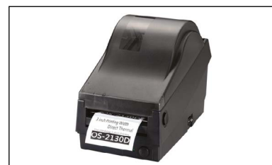
Stampante utilizzata per avere tutte le informazioni complete di data e ora. Stampante modello OS-2130D. (VEDI CAPITOLO ACCESSORI)